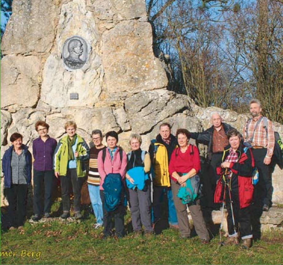
den Riechheimer Berg