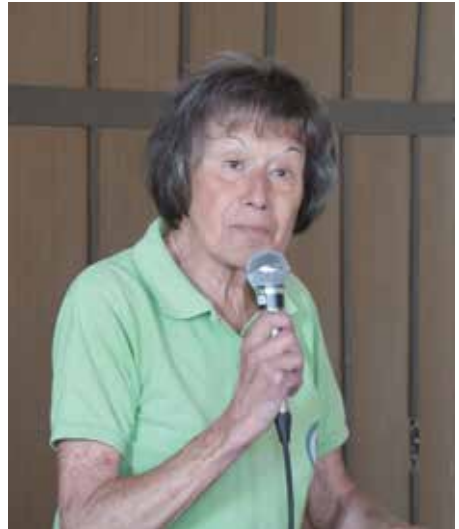
Die Vereinsvorsitzende eröffnet das Fest

musikalisch zu überbringen. Zwischen den Bebraer Singvögeln und unserem Wanderverein bestehen seit mehr als 30 Jahren freundschaftliche Beziehungen. Auch das jährliche Blutbuchenfest der Wanderer wird immer von ihnen musikalisch begleitet.