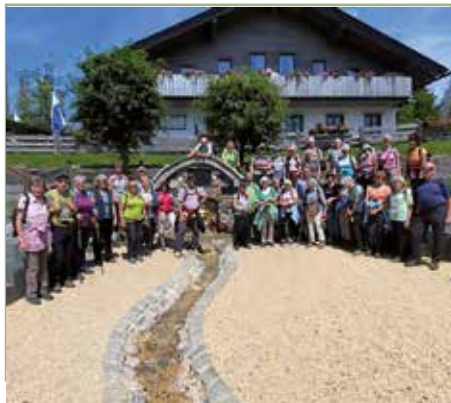
An der „echten“ Werraquelle“

Wir hatten gemeinsam viele Erlebnisse und Spaß.